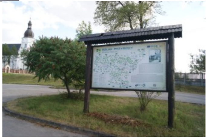
- Kościół p.w. św. Doroty i św. Tekli w Krasocinie