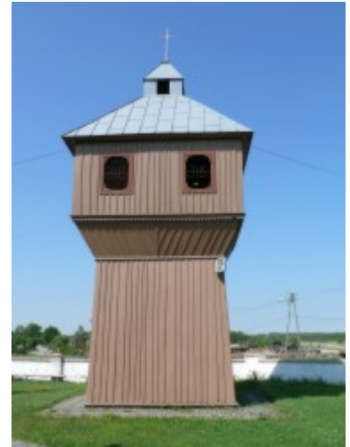
- Kościół p.w. Matki Boskiej Częstochowskiej w Kossowie (Gmina Radków)