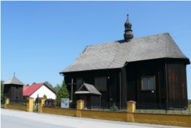
- Kościół p.w. św. Małgorzaty w Moskorzewie